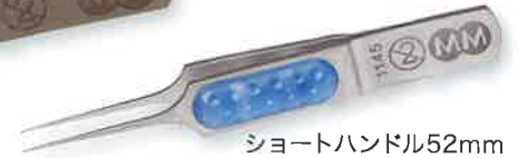
ショートハンドル52mm