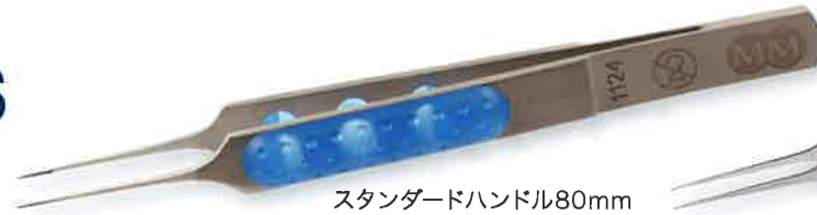
スタンダードハンドル80mm